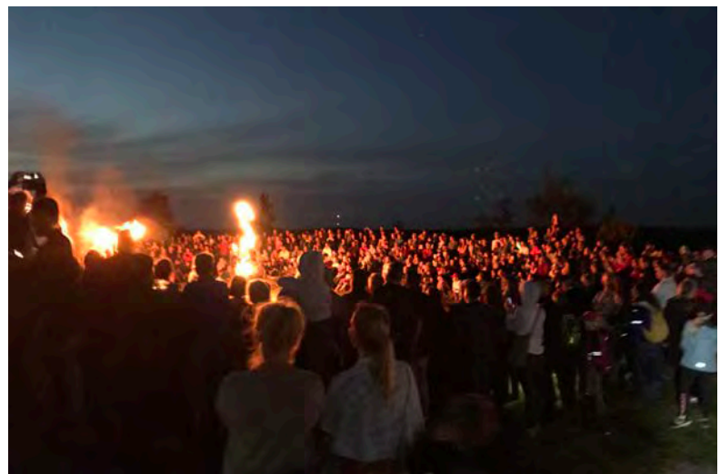
Elokuun viimeisenä lauantaina järjestetty koko perheen tapahtuma Linnavuoren yö veti linnavuoren laen täyteen väkeä. Pimenevässä illassa nautittiin Aura Companyn akrobatia- ja tulishowsta.