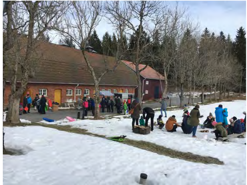
Laskiaissunnuntauille riitti vielä juuri ja juuri lunta mäenlaskuun ja talviseen ulkoiluun. Laskiaisen herkuista vastasi Åbo Cateringin.