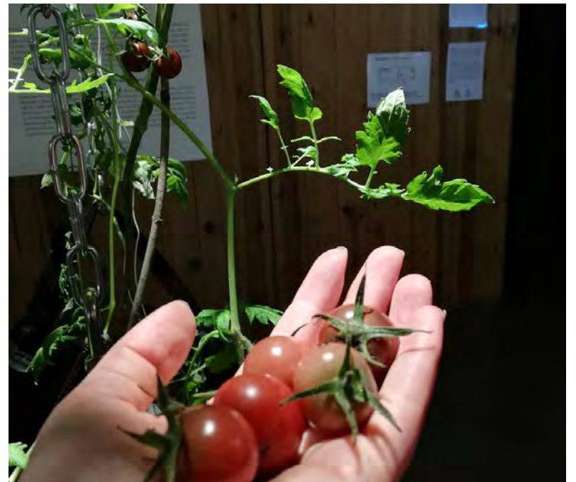
Kuvassa yllä: Silja Selosen teos "Genesis" ja Fern Orchestran "Nexus - Plant Series III".

Keskellä: "Nexus -Plant Series III". Tomaattiin kiinnitettiin kasvin elintoimintoja mittaavat sensorit ja signaalit muuttuivat valoksi. Tomaatin sähkövastuksen lisääntyessä myös valo lisääntyi. Kun kasvi "väsyi", valo himmeni. Tomaatti tuotti satoa ja museoväki pääsi pohtimaan myös kysymystä voiko taidetta syödä?