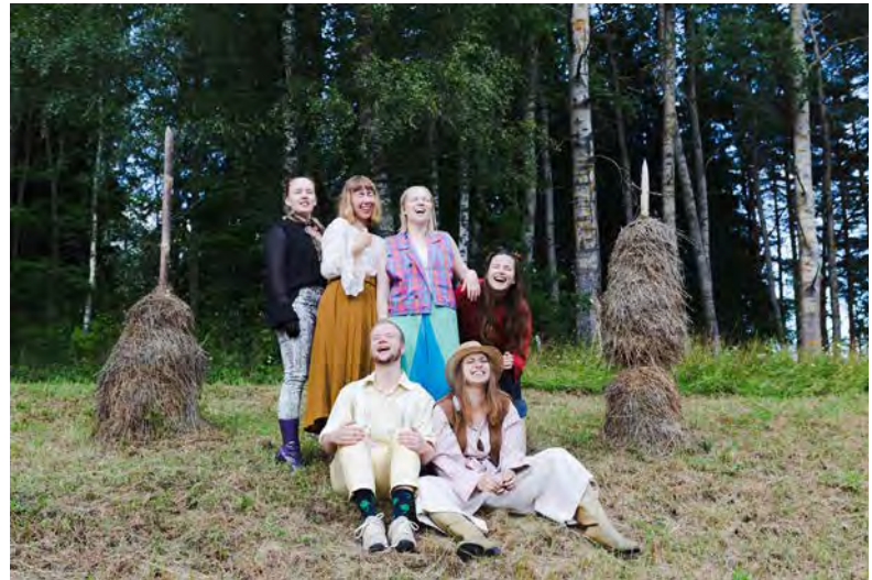
Turun Ylioppilasteatterin kesäteatterikappaleena oli Puskarfarsi 2019. Näytöksissä kävi yli 400 katsojaa.